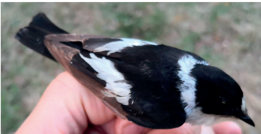
Tavon ensimmäinen sepelsiepporengastus - nuori koiras 3.6.2020.